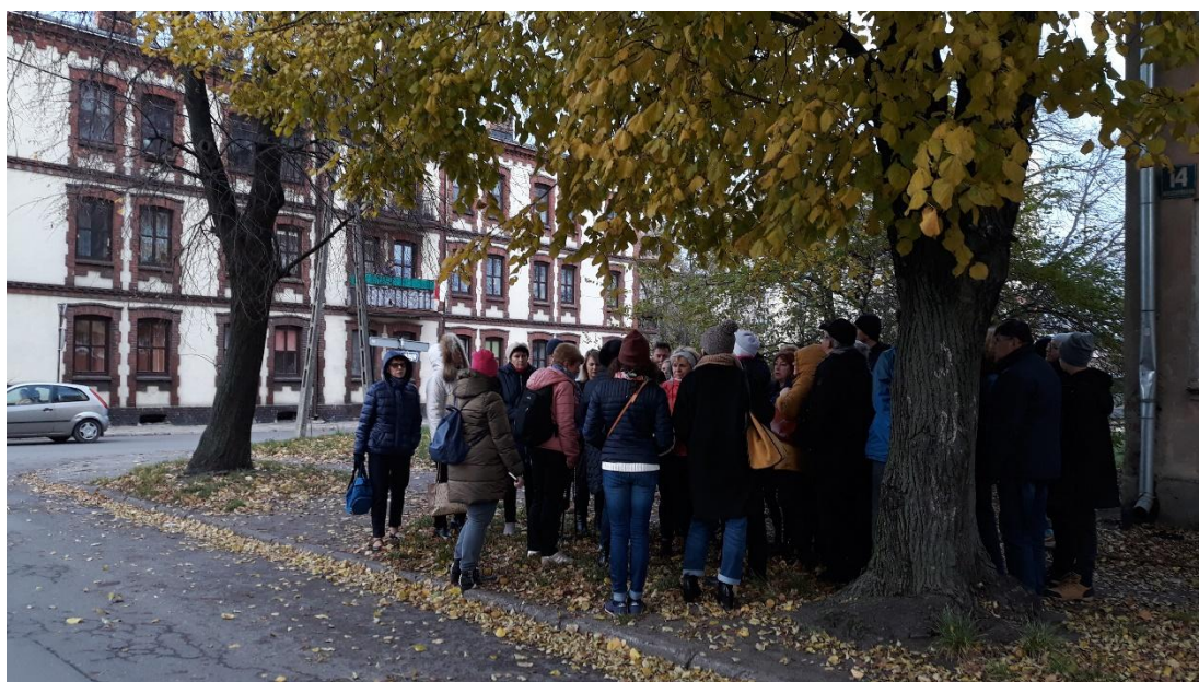
Zdjęcie 4. Spacer z przewodnikiem