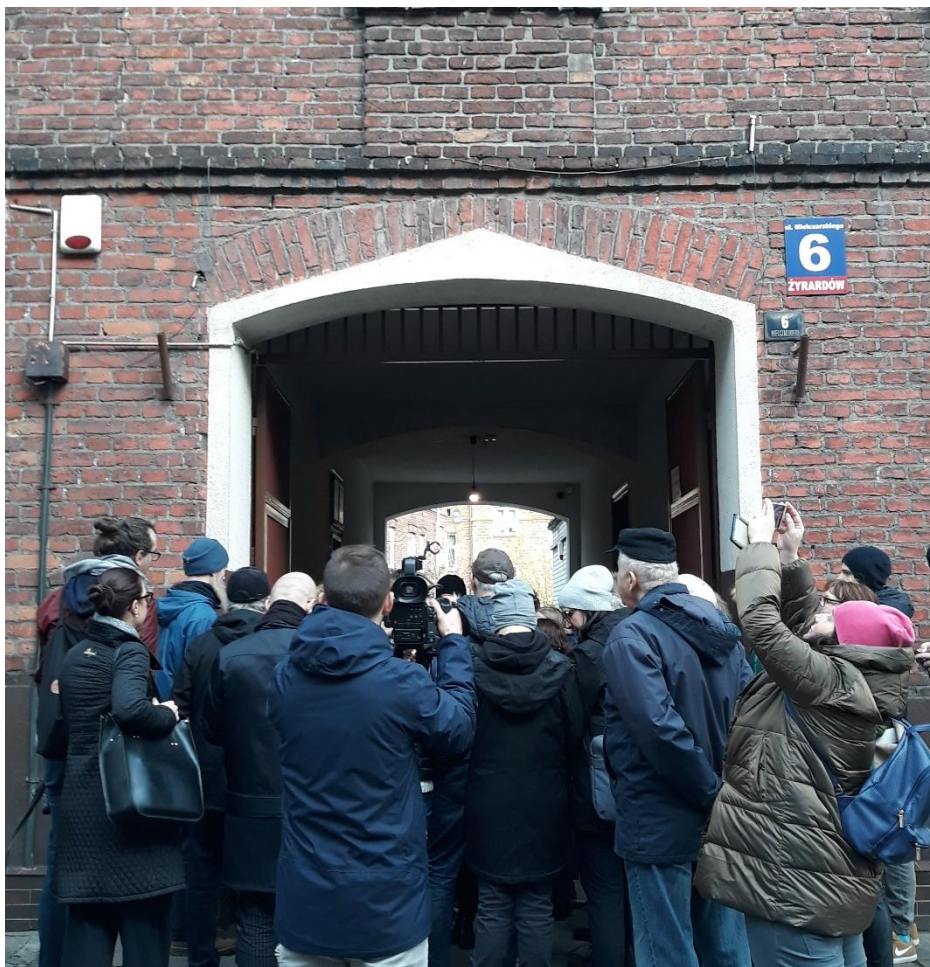
Zdjęcie 3. Spacer z przewodnikiem