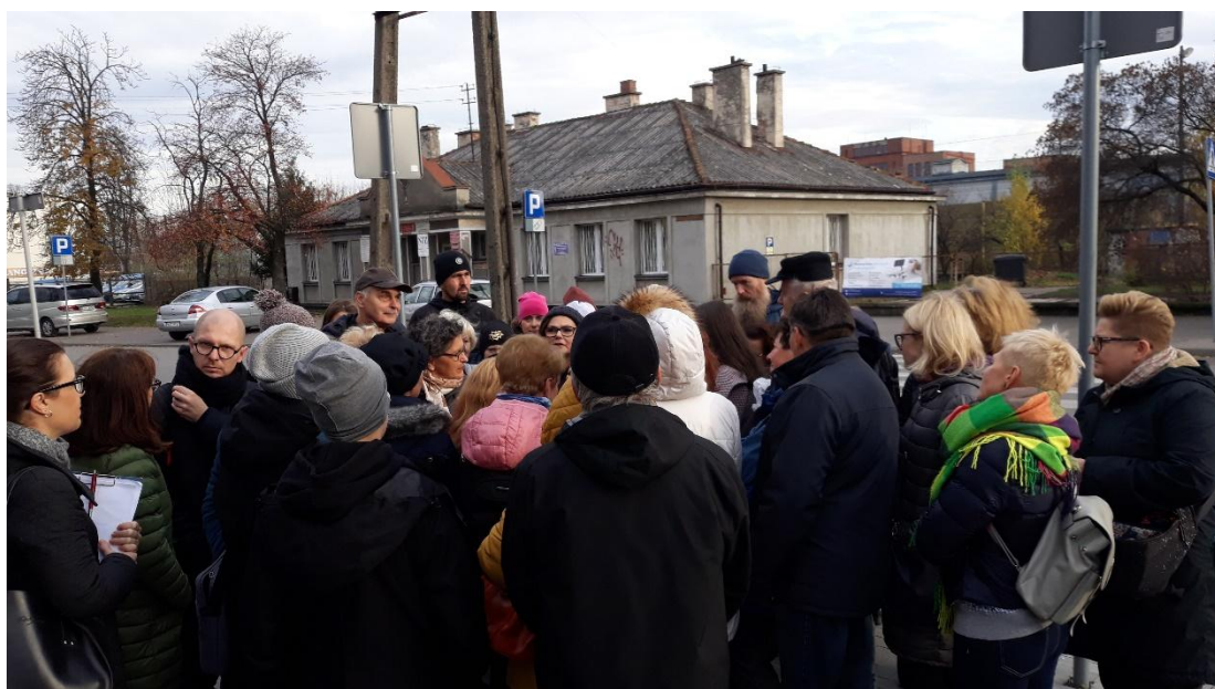
Zdjęcie 6. Spacer z przewodnikiem