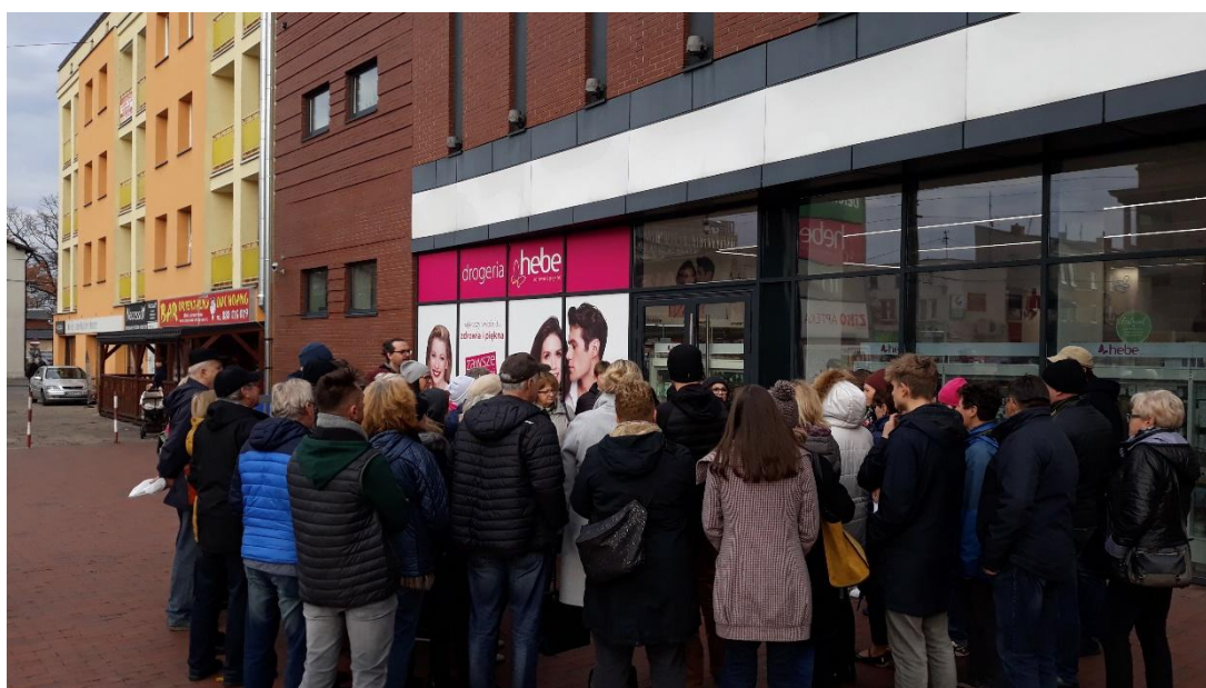
Zdjęcie 2. Spacer z przewodnikiem