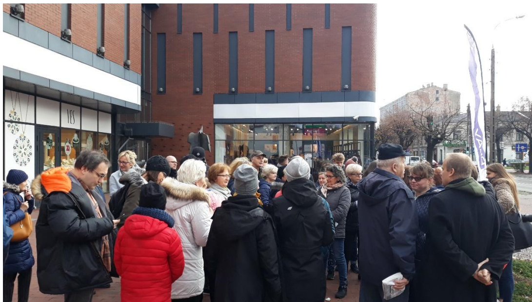
Zdjęcie 1. Spacer z przewodnikiem