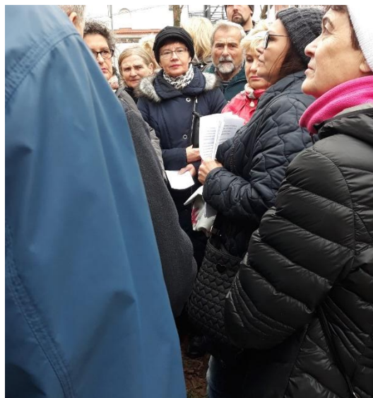
Zdjęcie 7. Spacer z przewodnikiem