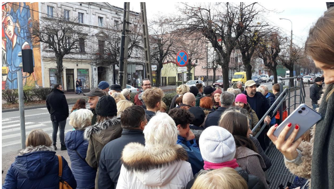
Zdjęcie 5. Spacer z przewodnikiem