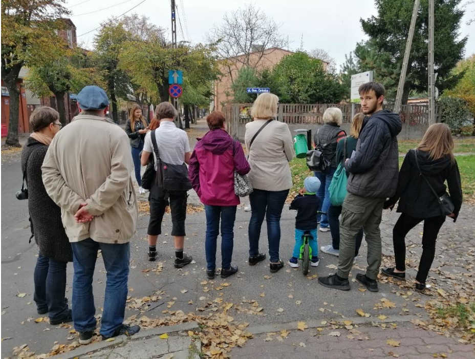
Zdjęcie 1. Spacer z przewodnikiem