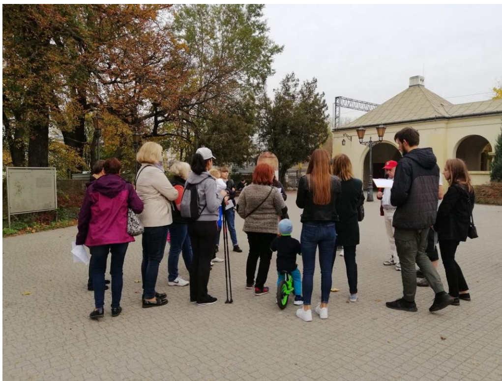
Zdjęcie 3. Spacer z przewodnikiem