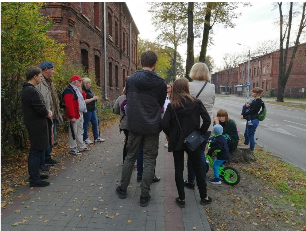
Zdjęcie 2. Spacer z przewodnikiem