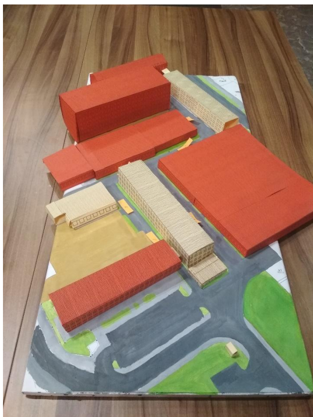
Zdjęcie 9. Makieta przygotowana na spotkanie z mieszkańcami - 21.08.2019 r.