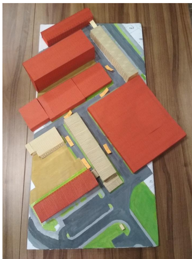
Zdjęcie 8. Makieta przygotowana na spotkanie z mieszkańcami - 21.08.2019 r.