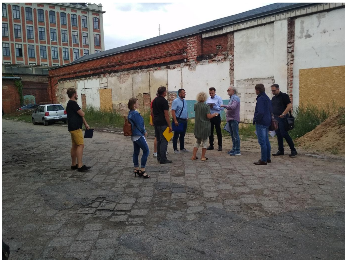
Zdjęcie 3. Dyskusje na temat organizacji ruchu na obszarze przeznaczonym do modernizacji – 21.08.2019 r.