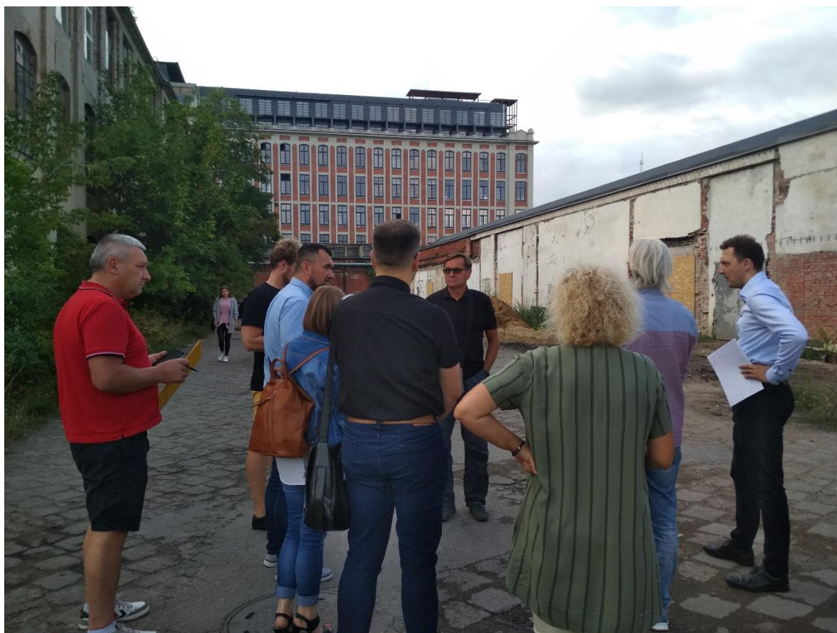
Zdjęcie 2. Rozmowa na temat stosunków własnościowych na obszarze przeznaczonym do modernizacji (w szczególności na temat działki 3519/5) – 21.08.2019 r.