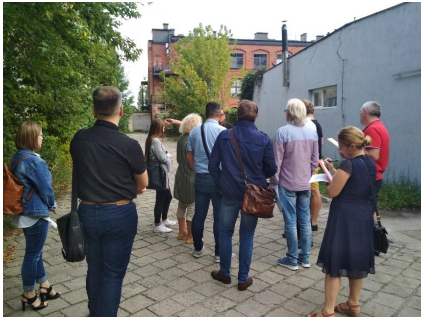
Zdjęcie 6. Dyskusja na temat dostępności komunikacyjnej budynku przy ulicy Lniarskiej 3 – 21.08.2019 r.

Uczestnicy spaceru zwracali uwagę na to, że wyburzenie starej stacji transformatorowej negatywnie wpłynie na atrakcyjność inwestycyjną budynku przy ul. Lniarskiej 3, ze względu na to, że z każdej strony będzie on otoczony ulicami. Twierdzili również, że stworzenie drogi jednokierunkowej między budynkami przy Lniarskiej 3 i Nowy Świat 8 może być znacznie utrudnione przez balkony, które wystają poza obrys budynku, a ich konstrukcja oparta jest na stalowej rurze, oddalonej metr od ściany budynku.