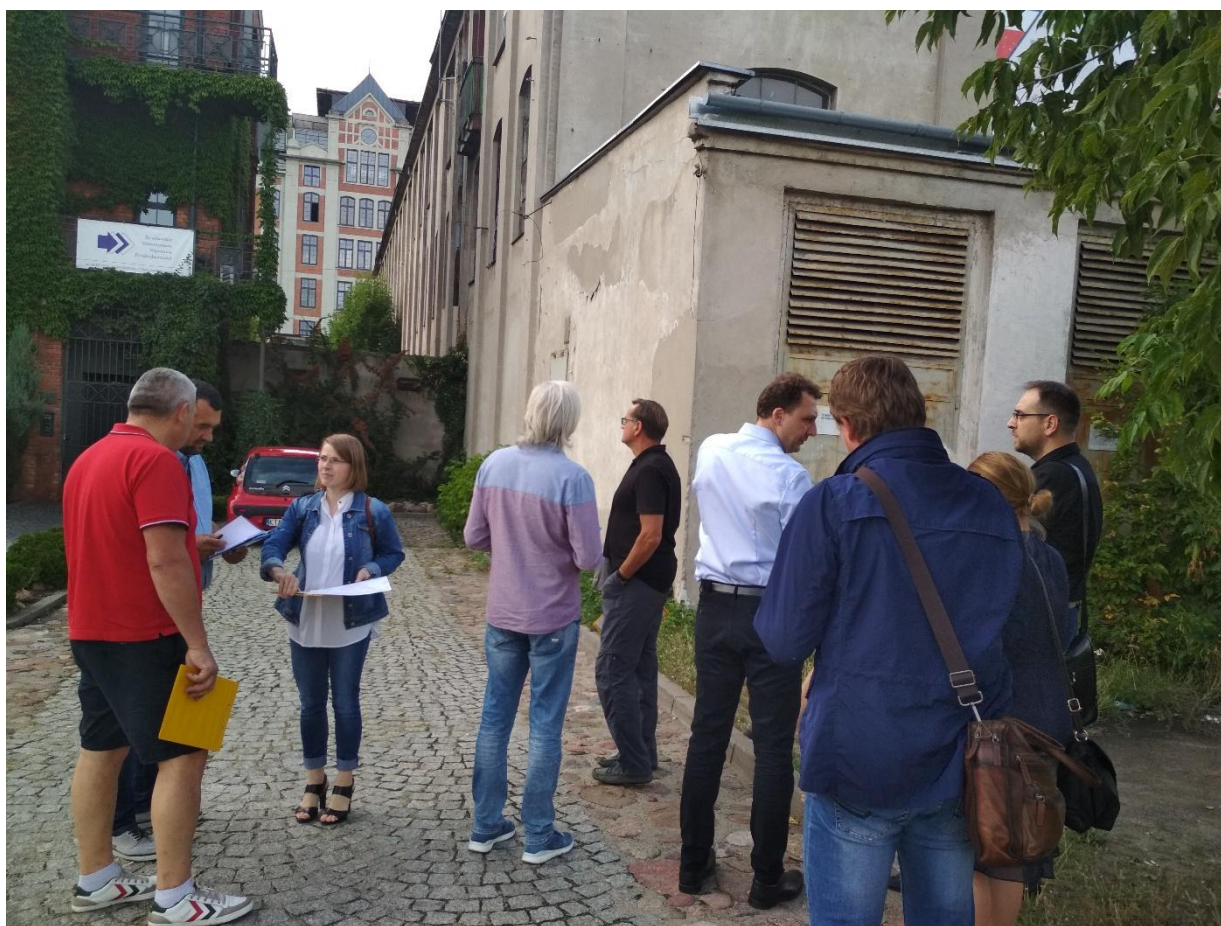
Zdjęcie 1. Dyskusja na temat likwidacji starej stacji transformatorowej w celu stworzenia drogi jednokierunkowej - 21.08.2019r.

Spacer rozpoczął się przy pomniku Szpularki przy ulicy Nowy Świat 8/1, gdzie przedstawiono cel spaceru i koncepcję organizacji ruchu na ulicy Lniarskiej. Mieszkańcy i przedsiębiorcy zgodnie doszli do wniosku, że modernizacja ulicy Lniarskiej jest niezbędna, ze względu na jej zły stan wizualny i techniczny, ale zwracali również uwagę na jej uwarunkowania historyczne i położenie w ścisłym centrum miasta. Pierwsze pytania, uwagi i postulaty dotyczyły pokazanego przez jednego z uczestników spaceru projektu zmian w stałej organizacji ruchu w drogach gminnych ul. 1 Maja i ul. Lniarska w związku z planowaną przebudową budynku „Starej Tkalni” (dz. Nr ew. 3519/25) w Żyrardowie.. Uczestnicy spaceru zadawali pytania odnośnie tego, czyją własnością jest budynek starej stacji transformatorowej i działka, na której jest zbudowany, ponieważ wskazany projekt zakłada wyburzenie tego obiektu. Zgłaszali również wątpliwości odnośnie słuszności przedstawianego projektu zmian w stałej organizacji ruchu i sugerowali w jaki sposób według nich powinna zostać zmodyfikowana. Stanowiska uczestników spaceru były zróżnicowane.