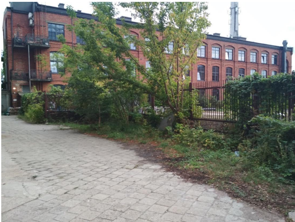
Zdjęcie 4. Nietwardzona działka za „Szpularnią” o numerze 3519/31, – 21.08.2019 r.