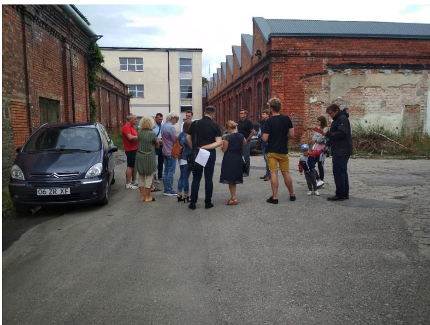
Zdjęcie 5. Dyskusja na temat zbyt małej liczbie planowanych miejsc parkingowych – 21.08.2019 r.

Uczestnicy spaceru zwracali uwagę na niedostateczną liczbę miejsc parkingowych. Zastanawiano się czy jest ewentualna możliwość usytuowania parkingu na działce 3519/26; wykorzystania (w formule PPP) istniejących miejsc parkingowych stworzonych przez lokalnego dewelopera. Aktualnie planowanych miejsc parkingowych przynależnych do budynku przy ul. Lniarskiej 4, w którym ma być galeria handlowa jest 25 od strony ulicy Lniarskiej i 25 od ulicy 1 Maja. – uczestnicy spaceru wskazywali, że jest to zbyt mała liczba w odniesieniu do potrzeb.