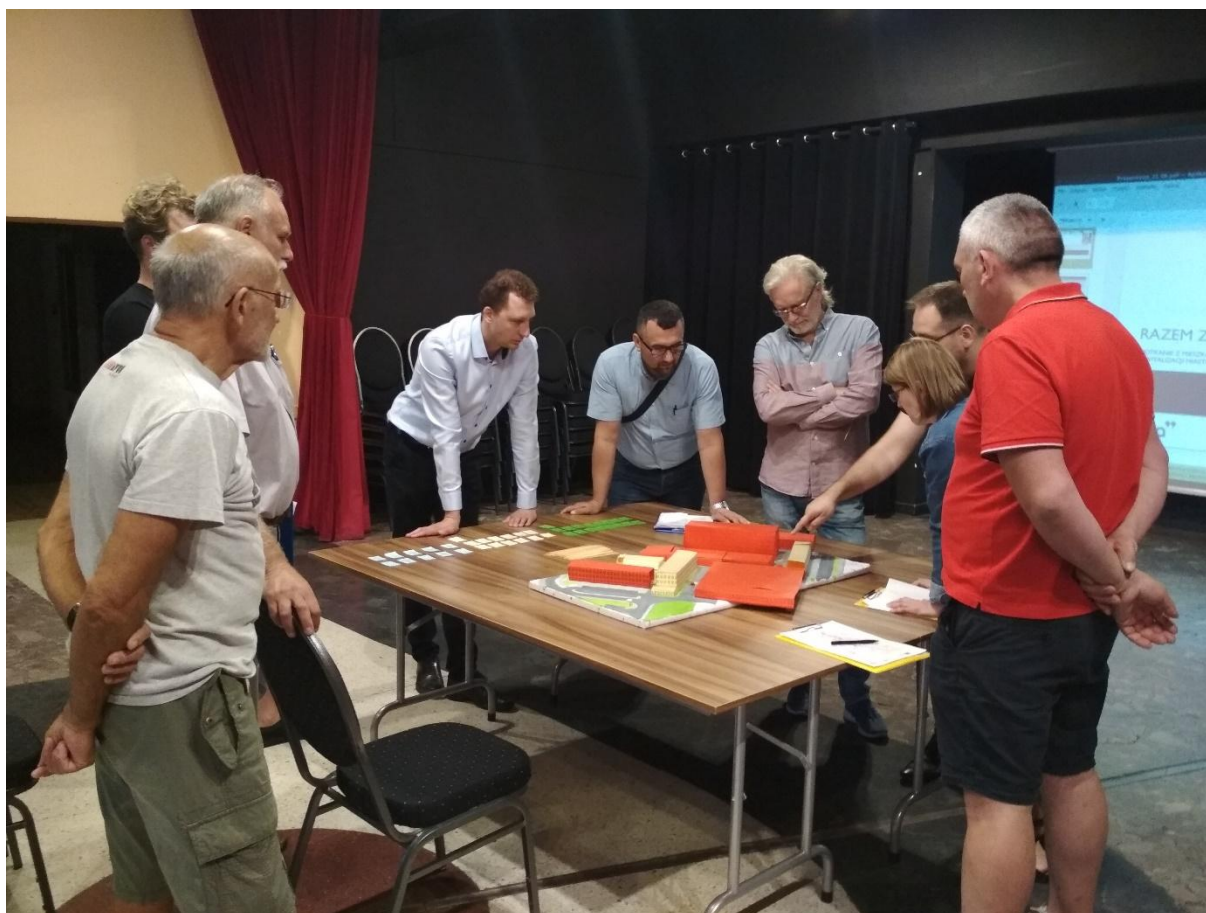
Zdjęcie 7. Opracowywanie wspólnych rozwiązań na przygotowanej makiecie obszaru przeznaczonego do modernizacji - 21.08.2019 r.