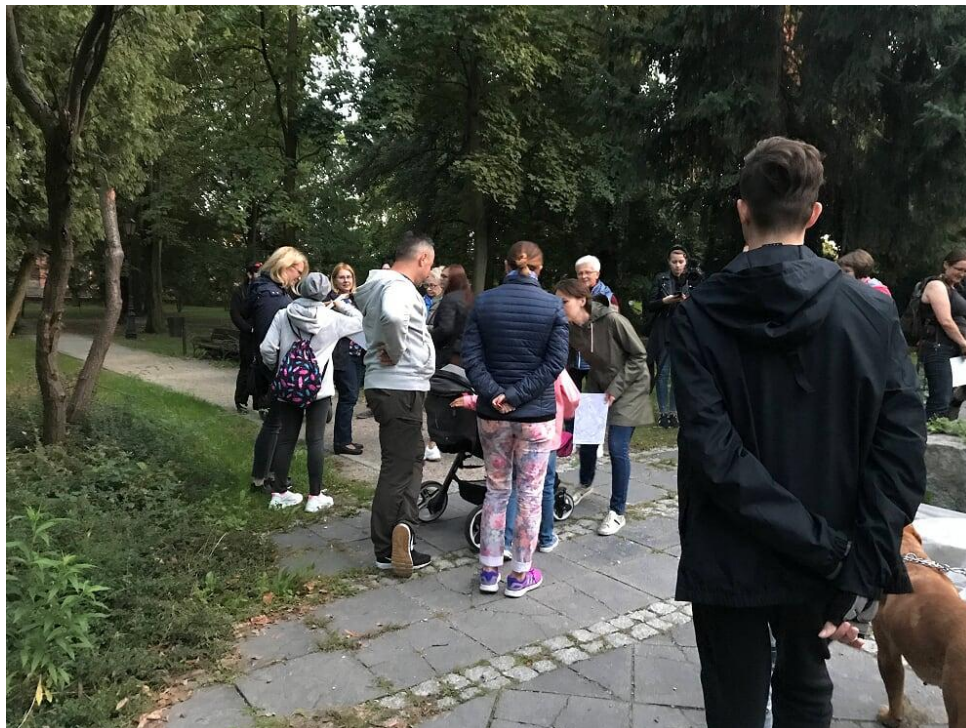
Zdjęcie. 1– Spacer z przewodnikiem