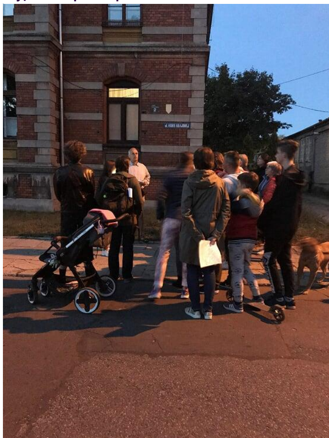
Zdjęcie. 3- Spacer z przewodnikiem