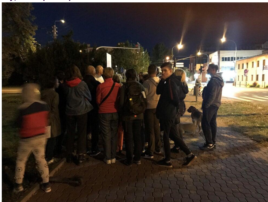
Zdjęcie 2- Spacer z przewodnikiem