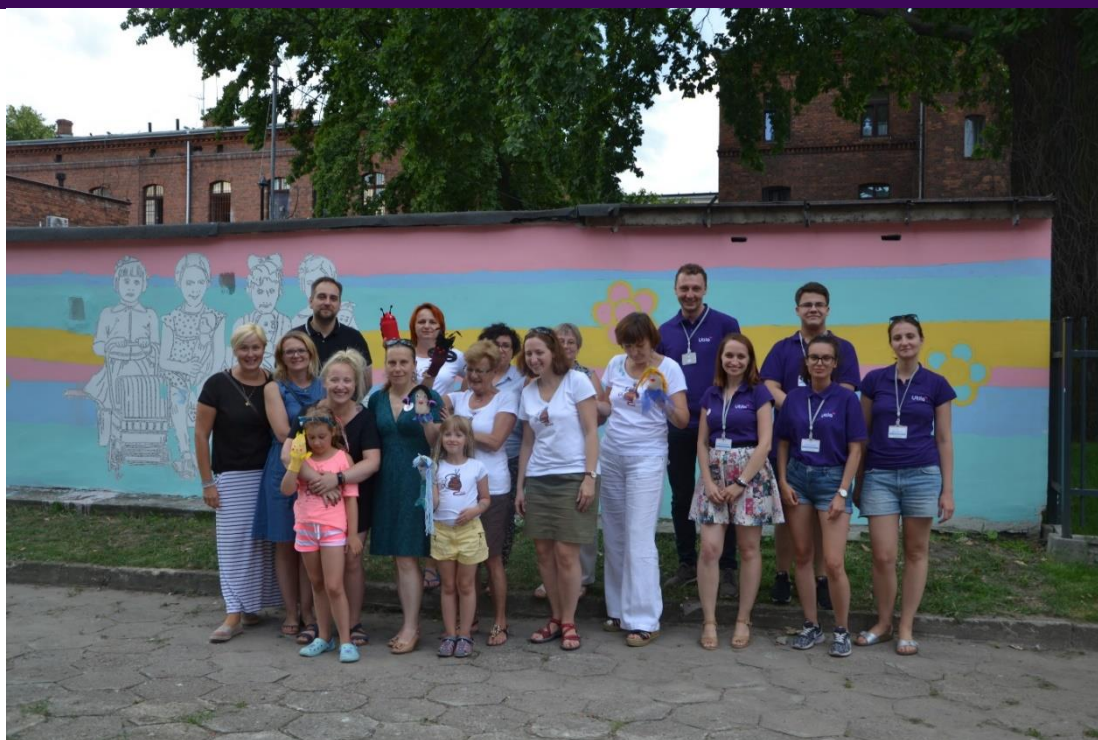
Zdjęcie 9. Część zespołu uczestniczącego w przygotowywaniu mikrofestynu, na tle muralu