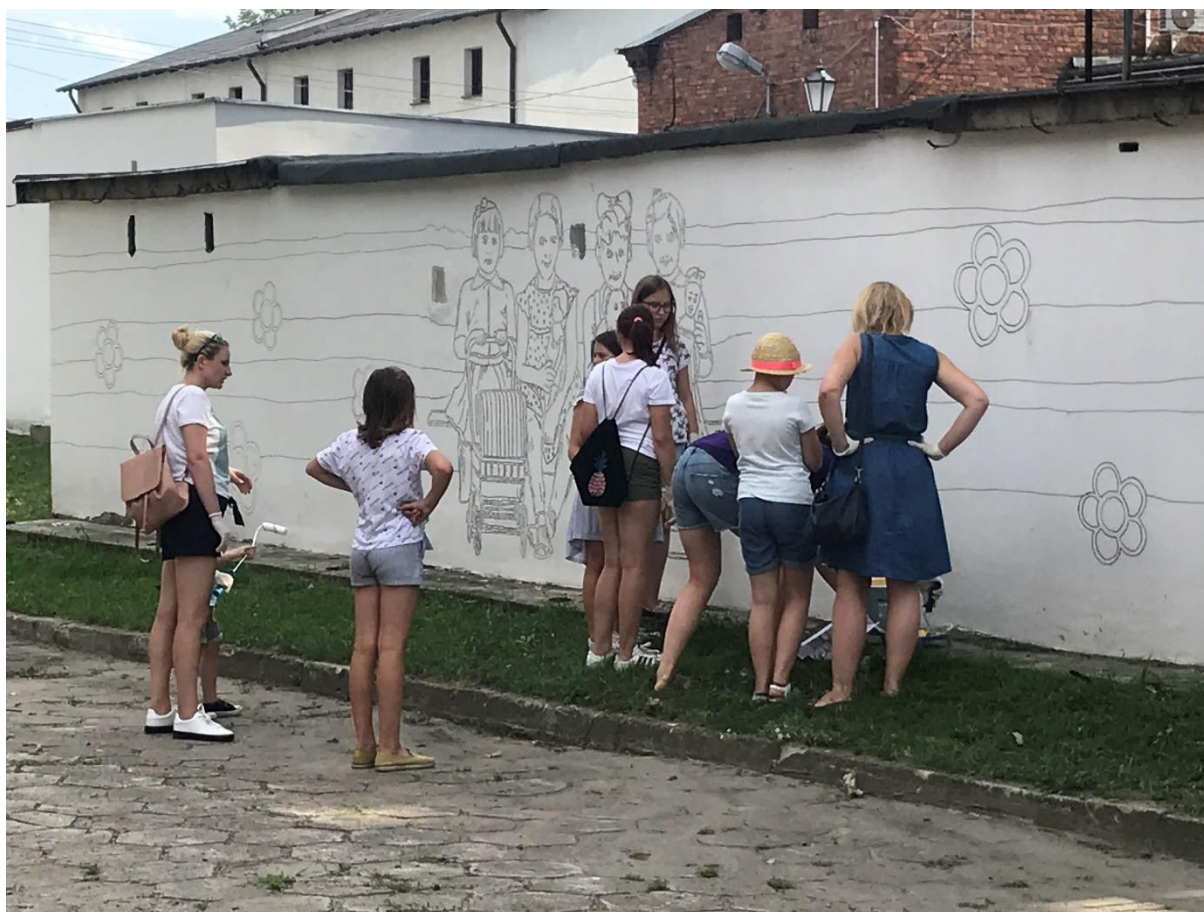
Zdjęcie 1. Rozpoczęcie prac nad murałem

15:00-20:00 – główną atrakcją mikro-festynu było wspólne tworzenie muralu na wcześniej przygotowanej ścianie z wykonanym obrysem zdjęcia. Do malowania mogła włączyć każda zainteresowana osoba, szczególnie dzieci, ale także rodzice, których dzieci korzystały z innych atrakcji podczas mikro-festynu. Kontury muralu zostały przygotowane kilka dni wcześniej. W dniu mikrofestynu, chętne osoby zostały wyposażone w pędzle, rękawiczki, farby i rozpoczęły malowanie wg przygotowanego projektu. Mural przedstawia cztery 7-8-letnie mieszkanki Żyrardowa. Jak się później okazało, jedna z uczestniczek mikrofestynu rozpoznała na przygotowanym projekcie siebie. W ten sposób, po prawie 60 latach dawne wychowanki Ochronki stały się sławne, a ich wizerunek został uwieczniony na murach przy Przedszkolu.