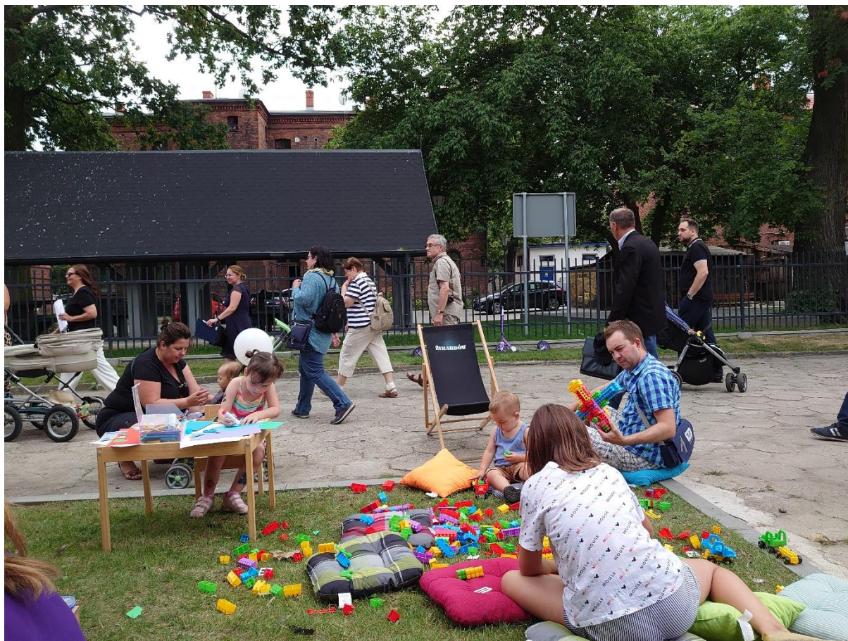
Zdjęcie 4. Strefa zabaw dla najmłodszych

Źródło: opracowanie własne, 27.07.2019 r.