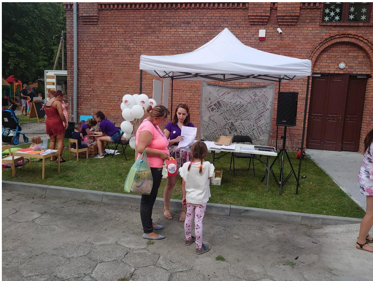
Zdjęcie 15. Stoisko rewitalizacyjne