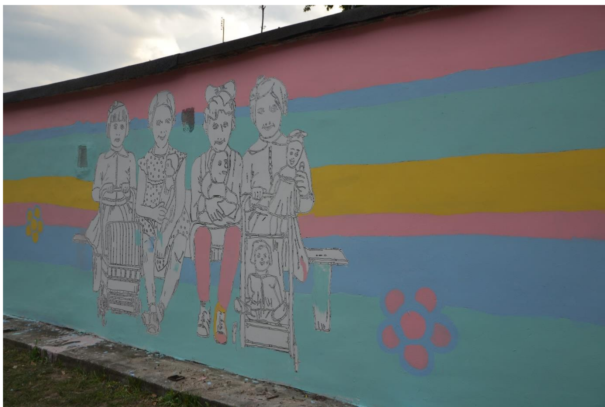
Zdjęcie 2. Mural po zakończeniu prac uczestników mikrofestynu

Źródło: opracowanie własne, 27.07.2019 r.