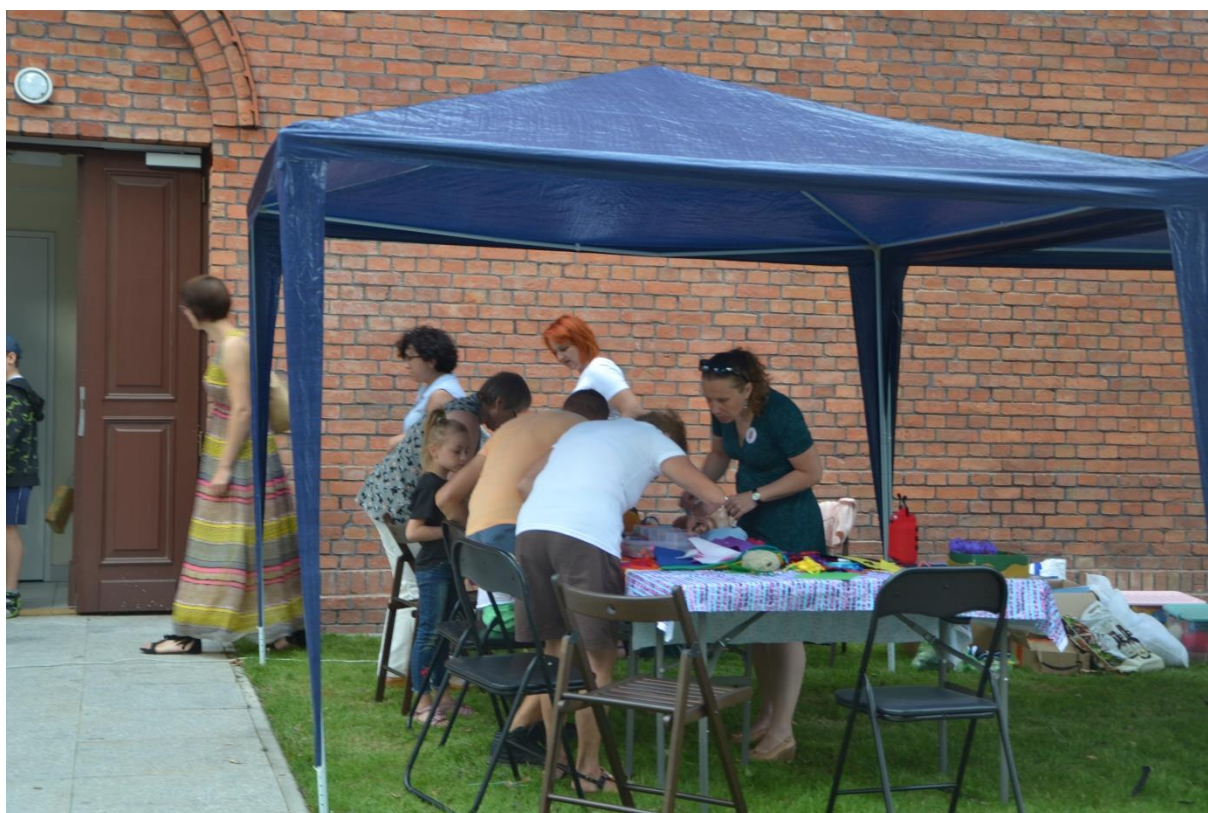
Zdjęcie 11. Warsztaty organizowane przez Żyrardowskie Utalentowane Rękodzielniczeki Kulturalne