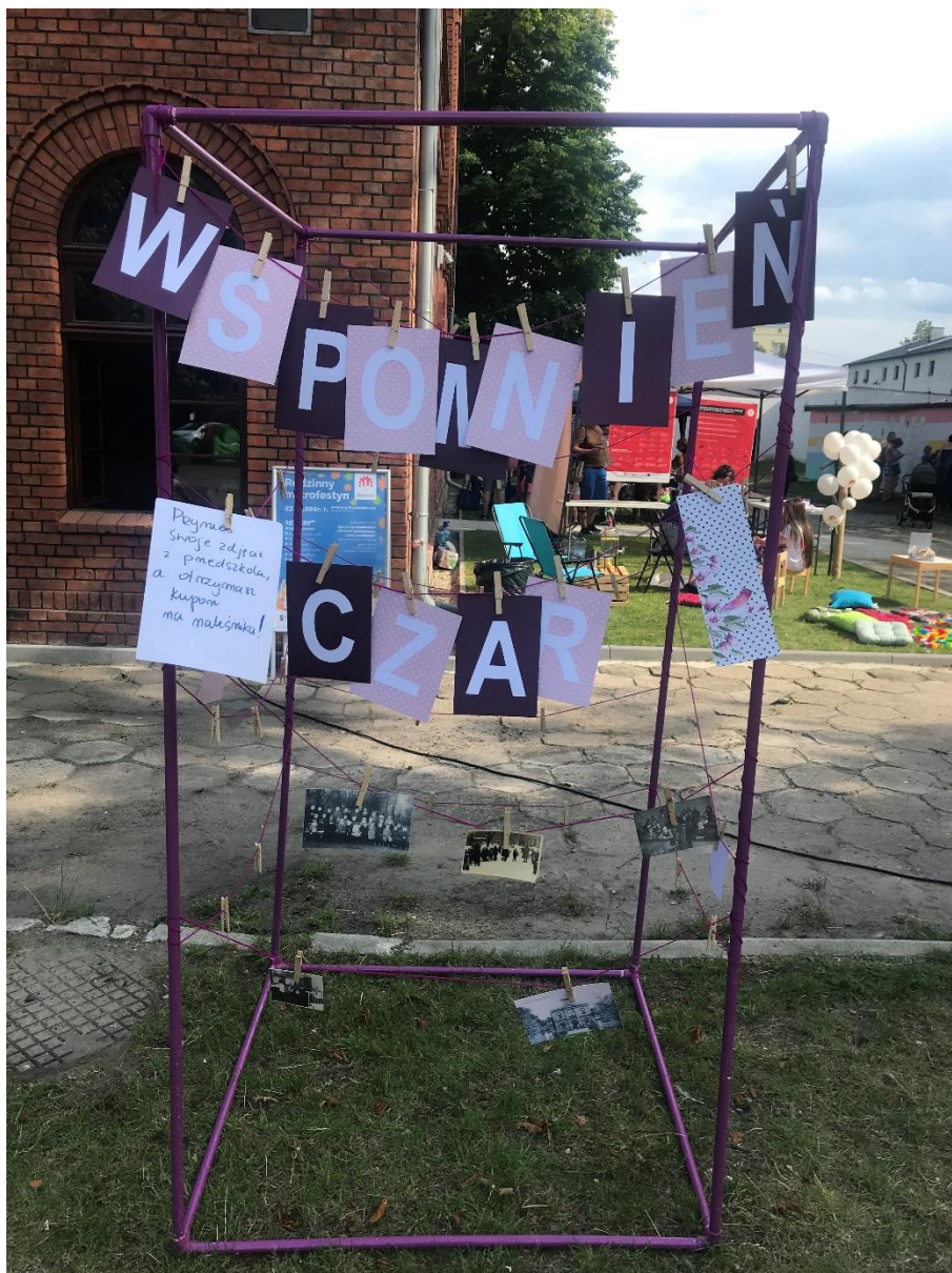
Zdjęcie 5. Przygotowana galeria na zdjęcia z czasów dzieciństwa