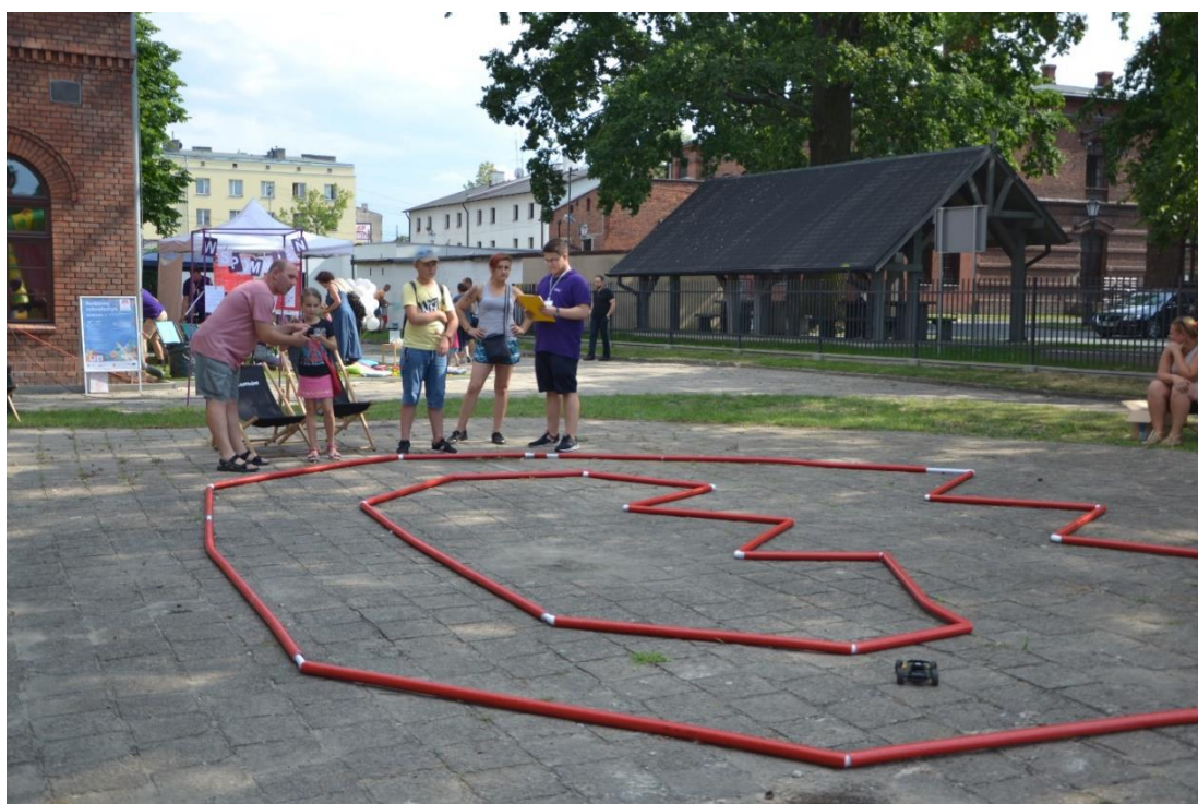
Zdjęcie 10. Tor dla samochodów zdalnie sterowanych