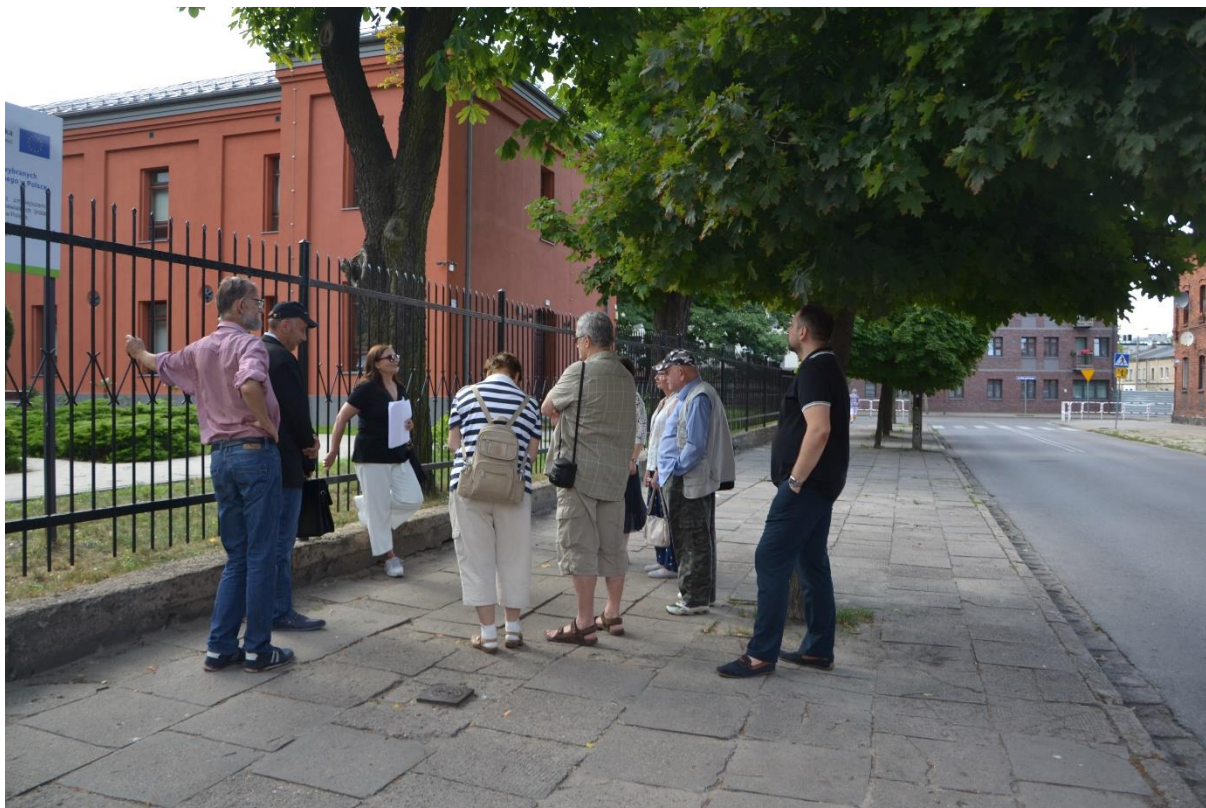
Zdjęcie 6. Uczestnicy spaceru „Szlakiem żyrardowskich szkół i przedszkoli”

Źródło: opracowanie własne, 27.07.2019 r.