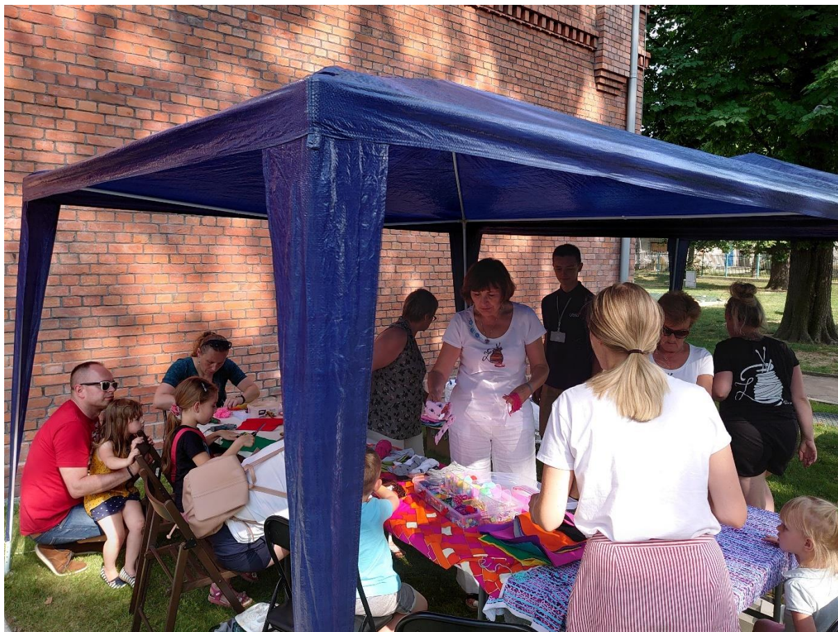
Zdjęcie 3. Praca na warsztatach kreatywnych

Źródło: opracowanie własne, 27.07.2019 r.