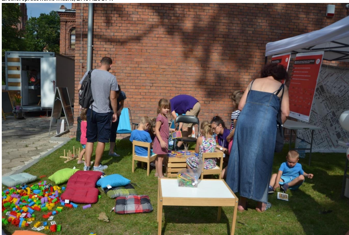
Zdjęcie 14. Kącik malowania twarzy i zabaw dla dzieci