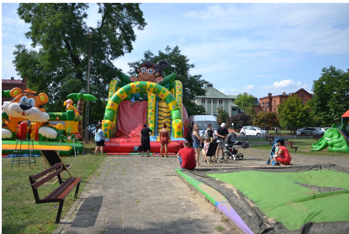
Zdjęcie 13. Dmucane atrakcje przygotowane dla uczestników festynu

Źródło: opracowanie własne, 27.07.2019 r.