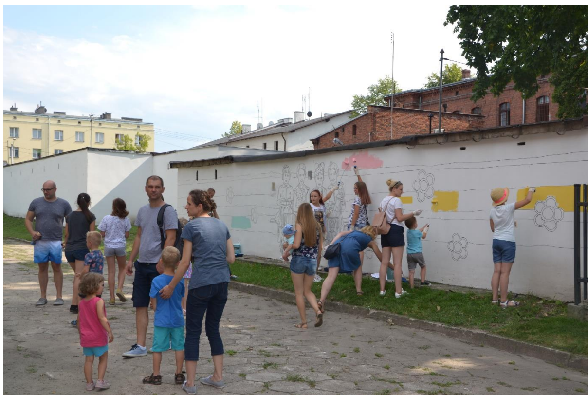
Zdjęcie 12. Uczestnicy festynu podczas malowania muralu