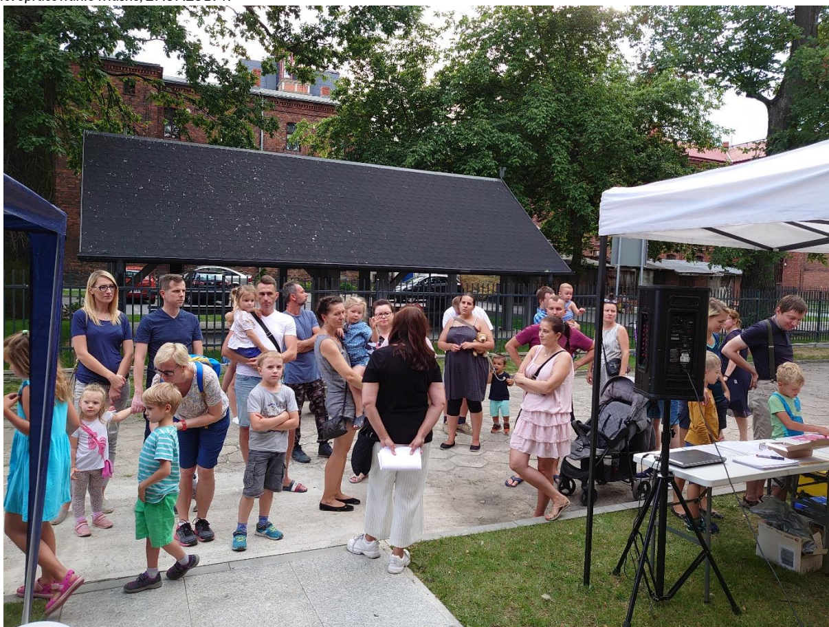
Zdjęcie 7. Uczestnicy spaceru, który za chwilę ma się rozpocząć o 18:00

27.07.2019 r.