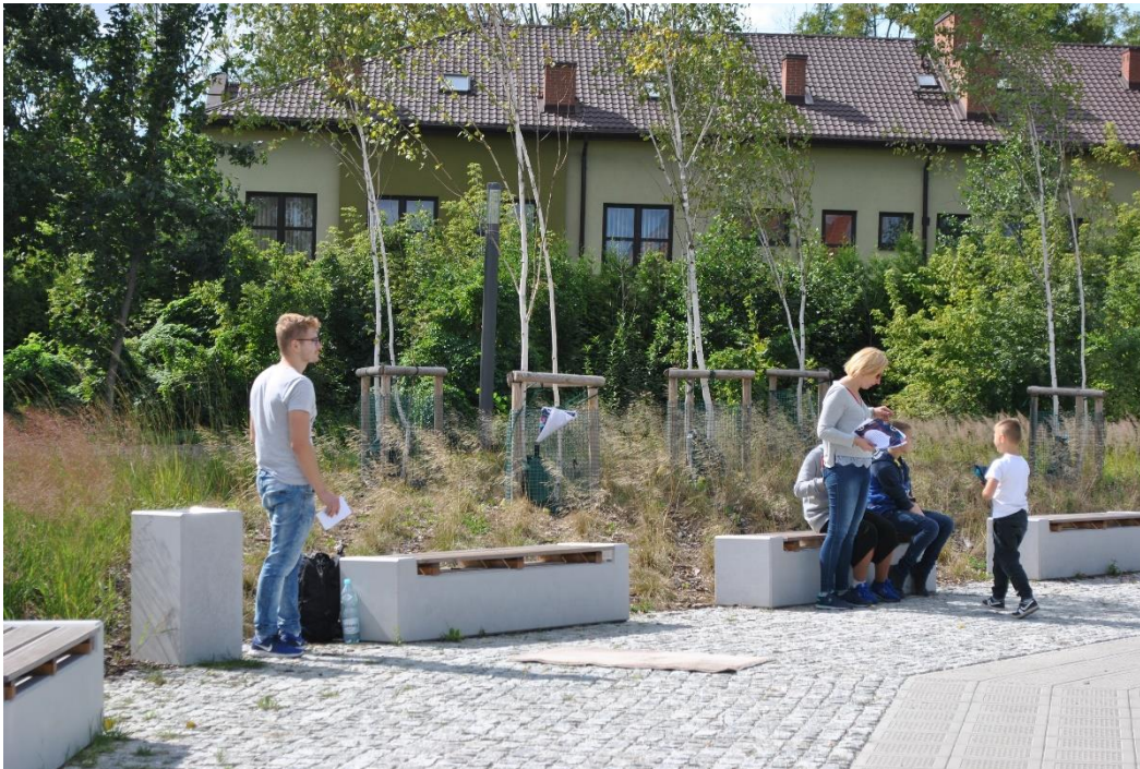
Zdjęcie 3. Punkt nr 3 przy Skwerze inż. Władysława Szrednickiego, 14.09.2019 r.

Projekt współfinansowany jest ze środków Unii Europejskiej w ramach Programu Operacyjnego Pomoc Techniczna 2014-2020