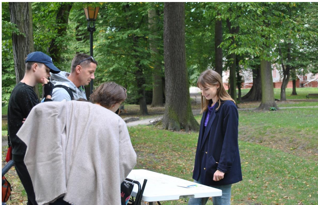
Zdjęcie 2. Punkt nr 2 w Parku Dittricha przy ul. Dittricha 1, 14.09.2019 r.

Przy drugim punkcie uczestnicy mieli za zadanie rozpoznać filmy/seriale, które były kręcone na terenie Żyrardowa.