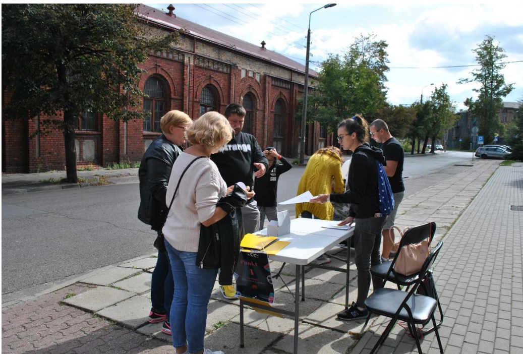
Zdjęcie 4. Punkt nr 4 przy ulicy Chopina, 14.09.2019 r.