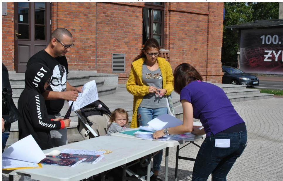
Zdjęcie 1. Punkt nr 1 przed Resursą przy ul. 1Maja 45, 14.09.2019 r.

Oprócz tego osoby biorące udział w grze losowały jeden z opisów filmu i podczas całej gry szukają do niego idealnego kadru. Wykonane zdjęcie można było wydrukować pod koniec gry.