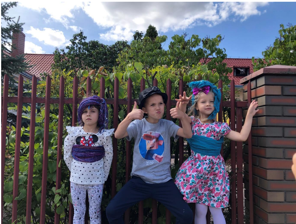
Zdjęcie 6. Punkt nr 6 przy Skwerze między ul. Limanowskiego i ul. Przedszkolną

Ostatnie zadanie polegało na wcieleniu się w kostiumologa. Należało przebrać przynajmniej jedną osobę z drużyny w strój, który umożliwi mu odegranie wylosowanej postaci z filmu.