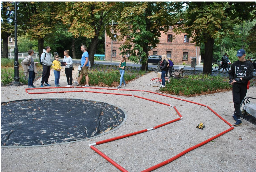
Zdjęcie 5. Punkt nr 5 przy Skwerze przy ul. Żeromskiego, 14.09.2019 r.

Projekt współfinansowany jest ze środków Unii Europejskiej w ramach Programu Operacyjnego Pomoc Techniczna 2014-2020