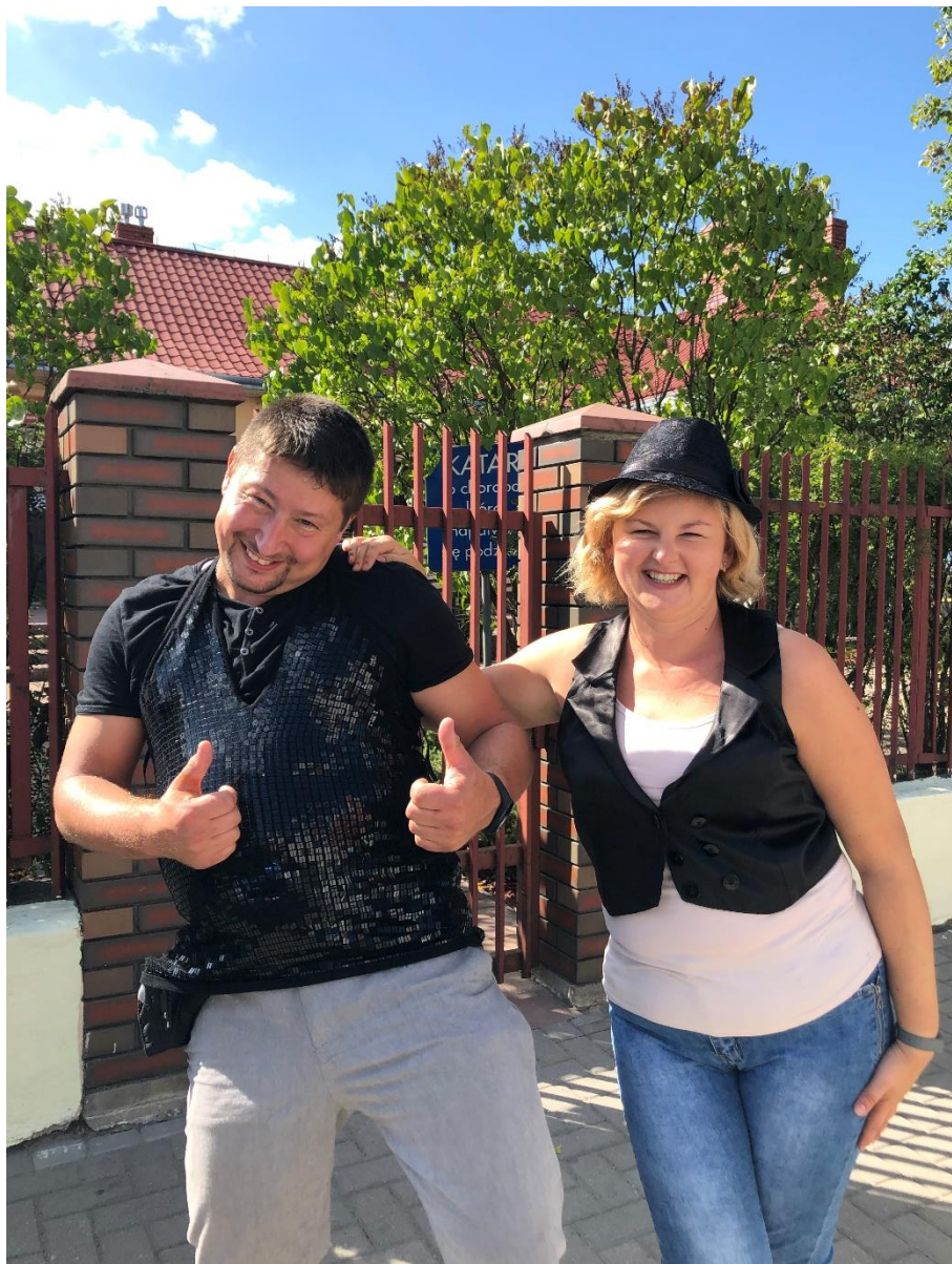
Zdjęcie 7. Punkt nr 6 przy Skwerze między ul. Limanowskiego i ul. Przedszkolną