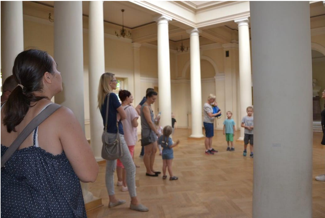
Zdj. 5 – Spacer z przewodnikiem, 27.07. 2019