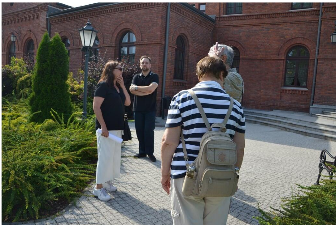
Zdj. 1- Spacer z przewodnikiem – przed budynkiem Resursy