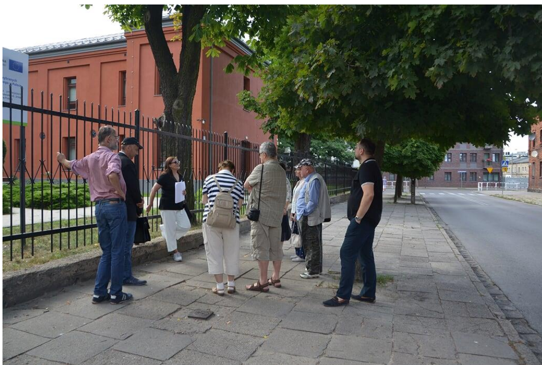
Zdj. 2 - Spacer z przewodnikiem, 27.07. 2019