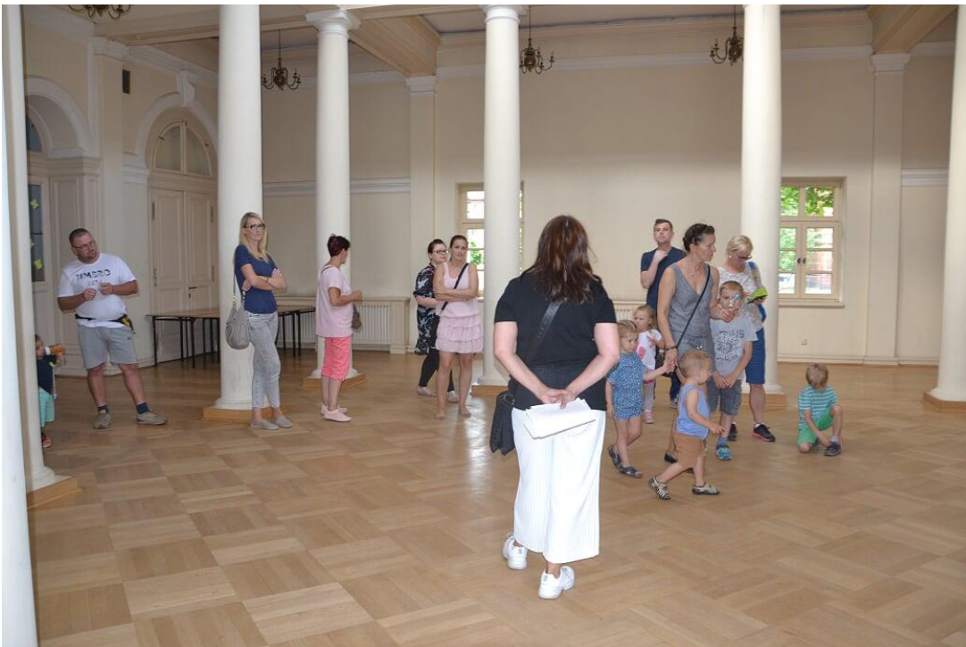
Zdj. 6 – Spacer z przewodnikiem, 27.07. 2019