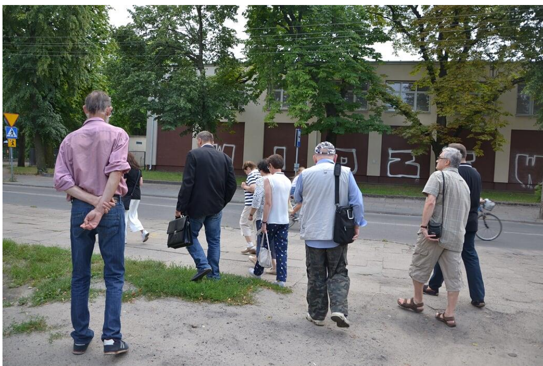
Zdj. 3 - Spacer z przewodnikiem, 27.07. 2019