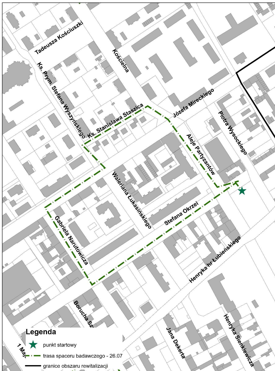
Rysunek 2. Trasa spaceru badawczego

Spacer badawczy 26.07.2019 (piątek) 17.00 -18.00