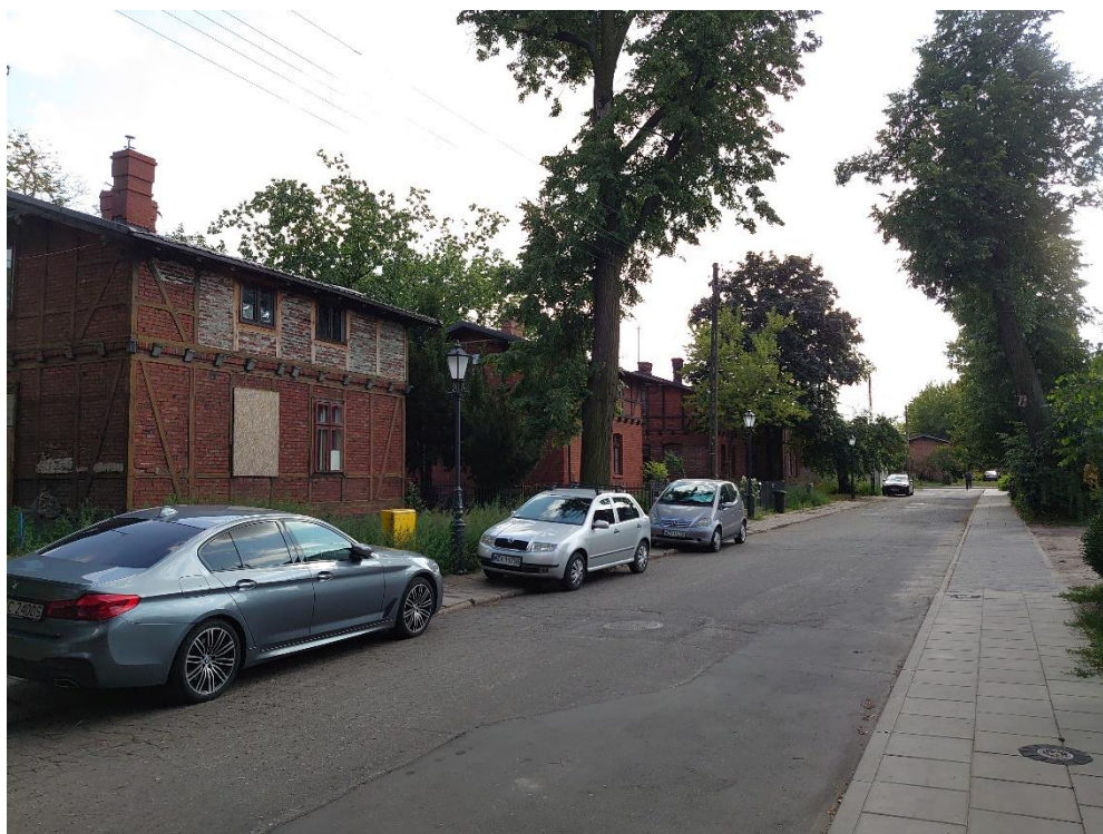
Zdjęcie 3. Budynki przy ul. Staszica

Źródło: opracowanie własne, wykonano 26.07.2019.