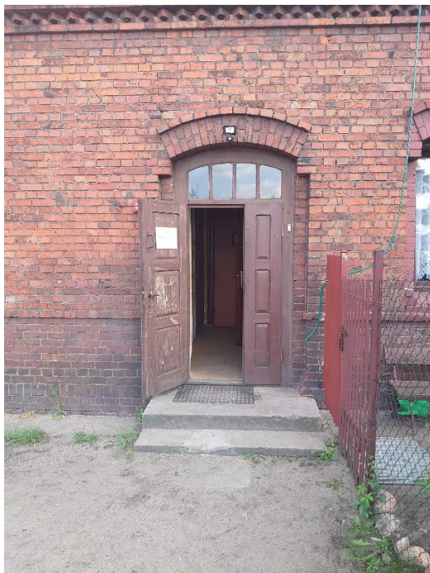
Zdjęcie 2. Wymagające wymiany drzwi wejściowe do budynku przy ul. Staszica 4