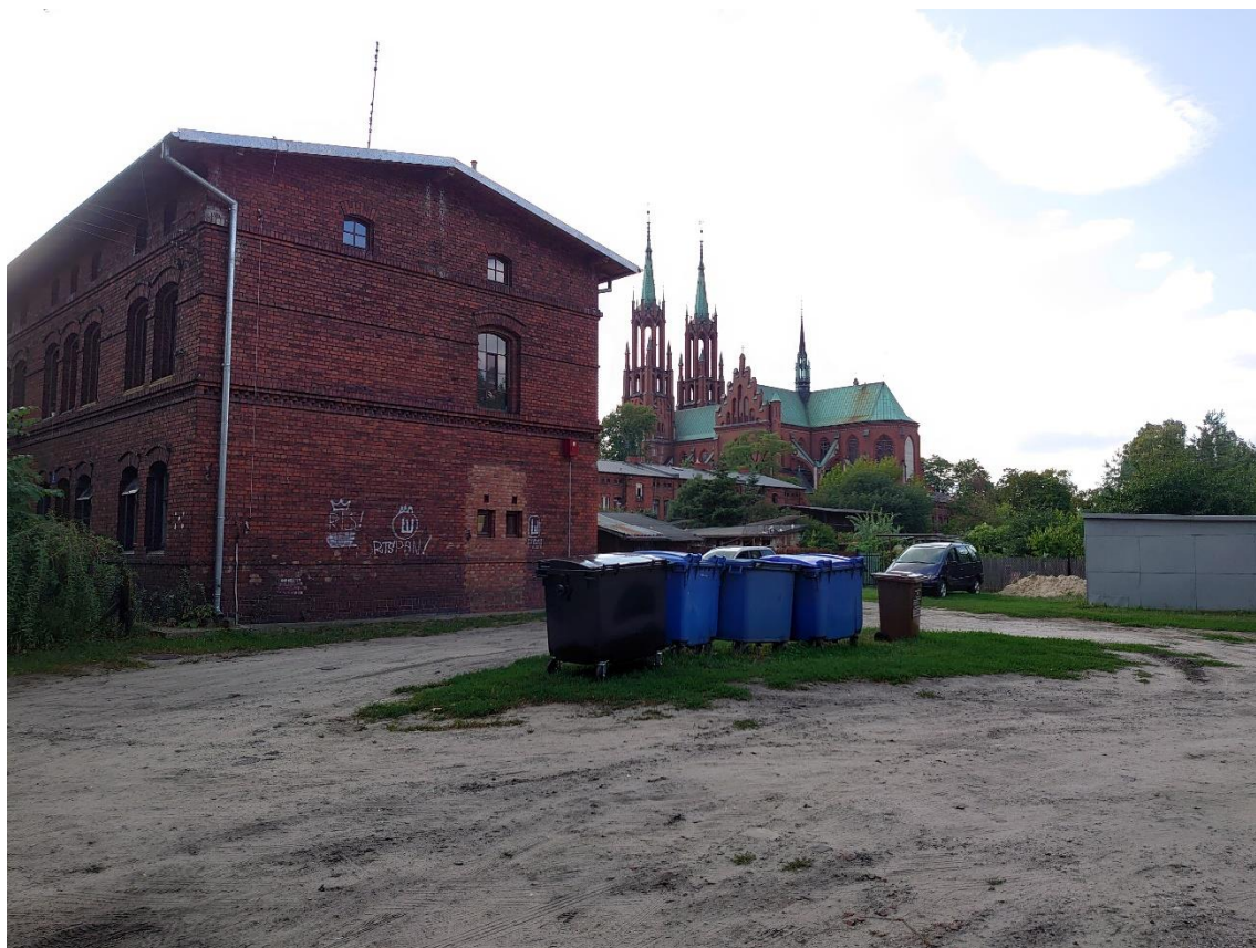
Zdjęcie 1. Aktualne zagospodarowanie podwórka przy ul. Staszica 4

Podczas spaceru zwrócono uwagę na konieczność poprawy ustawienia sygnalizacji świetlnej : wskazywano na zbyt krótkie światła na rogu Okrzei i Partyzantów, których długość trwania jest niewystarczająca dla osób starszych oraz na brak sygnalizacji świetlnej dla pieszych na rogu ul. Mireckiego i Narutowicza.