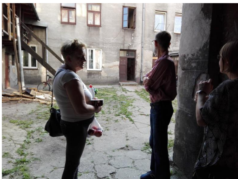
Zdjęcie 4. Wnętrze podwórka przy ul. Narutowicza